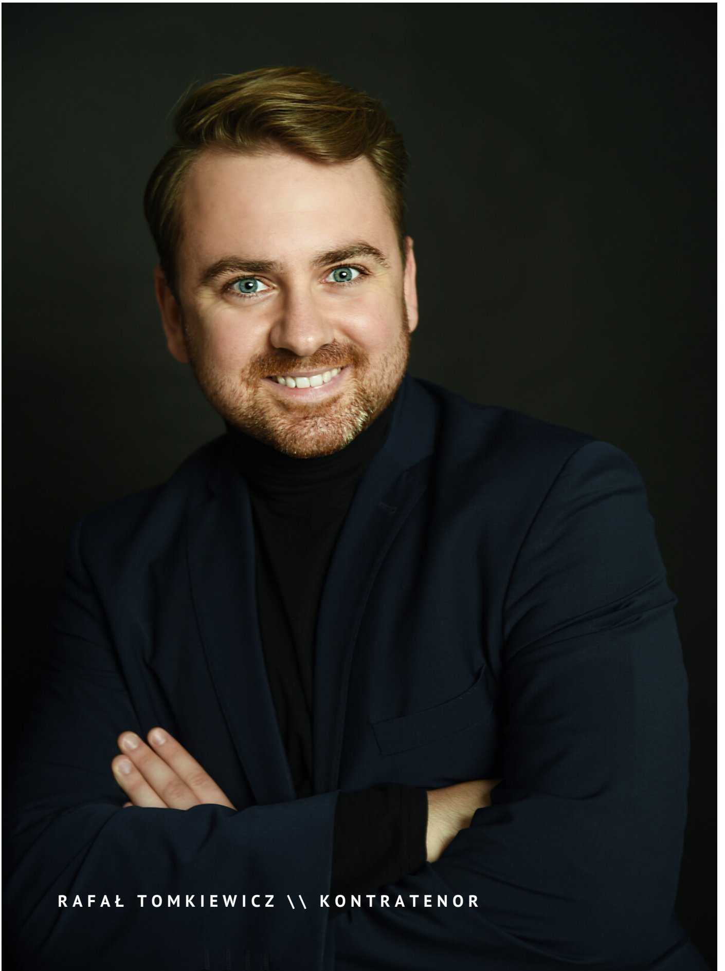
RAFAŁ TOMKIEWICZ \ \ KONTRATENOR