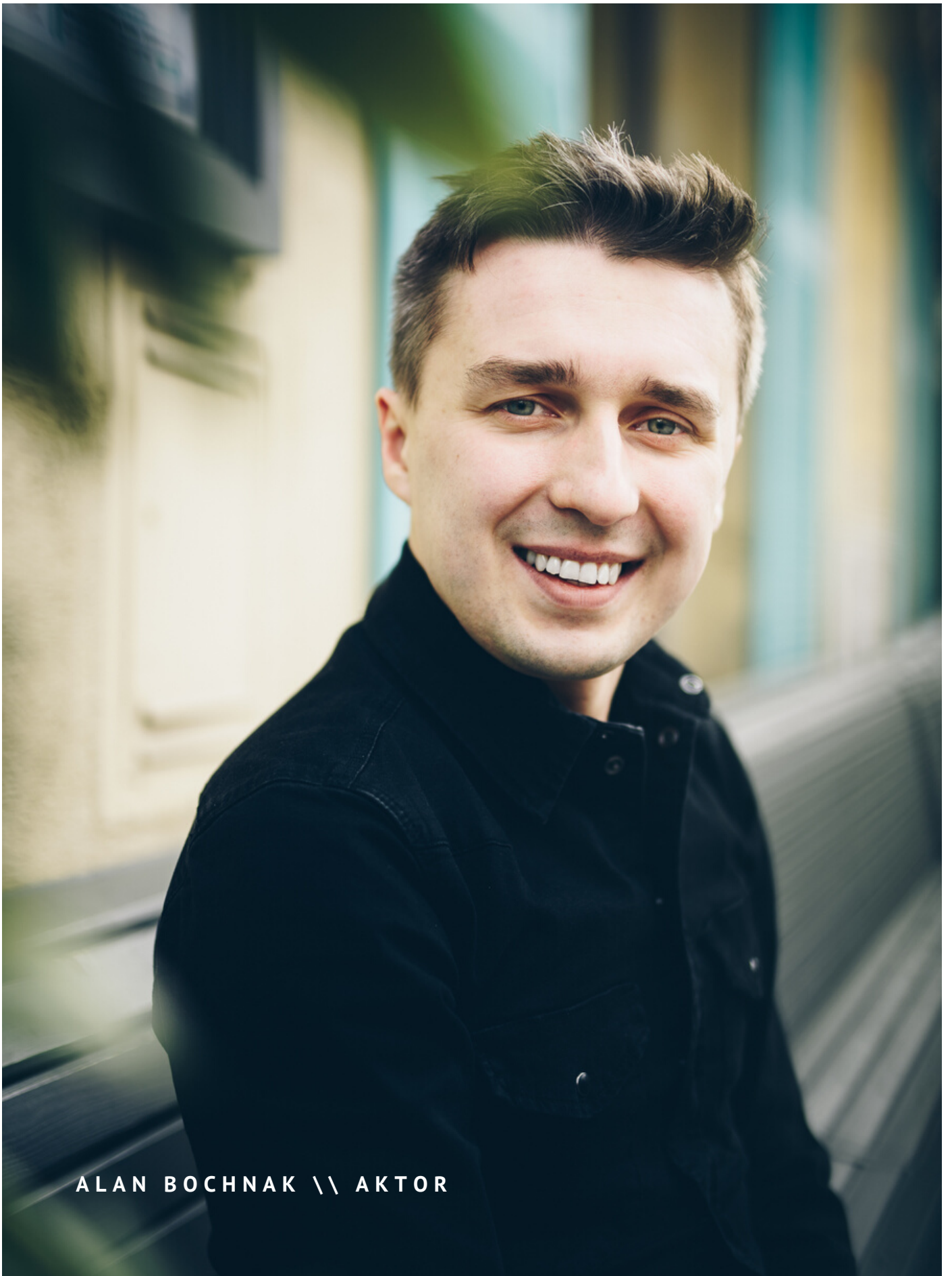
ALAN BOCHNAK \ \ AKTOR