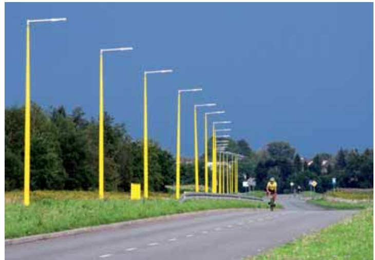
Ulica Lotników przed i po modernizacji