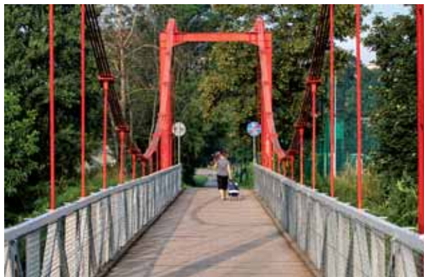
Kładka przy ul. A. Fredry przed i po renowacji