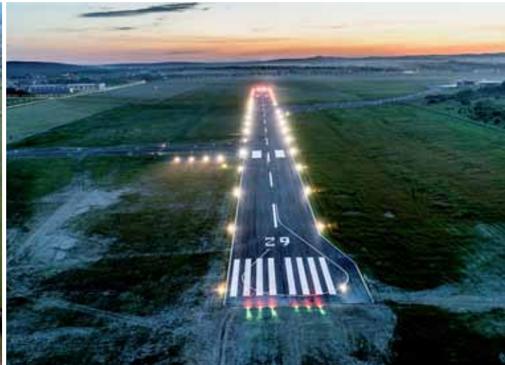
Pas startowy przed i po modernizacji