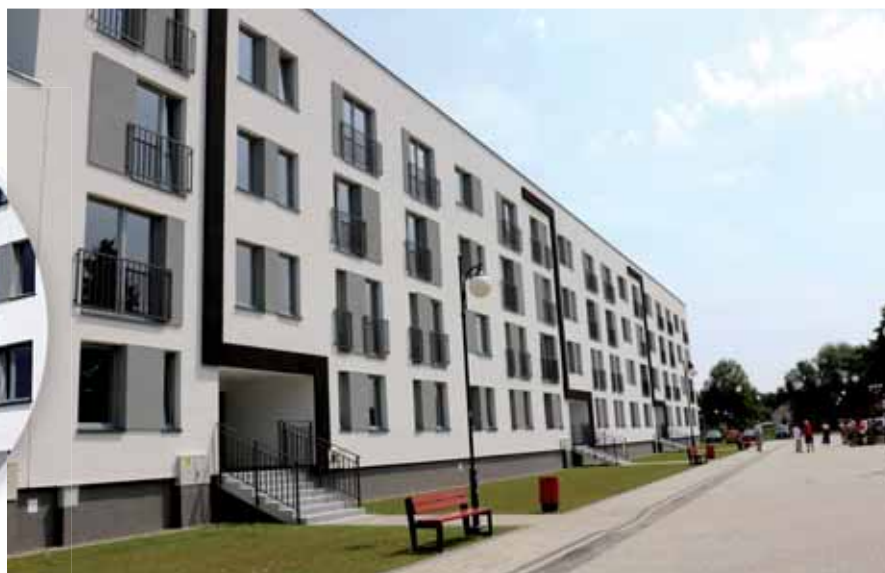
Zmodernizowany budynek mieszkalny przy ul. Rzeszowskiej

Towarzystwo Budownictwa Społecznego w Krośnie przebudowało trzy budynki byłej burzy szkolnej przy ul. Sportowej w Krośnie. Powstały 84 lokale mieszkalne przeznaczone pod wynajem. Teren został zagospodarowany, powstały miejsca parkingowe i plac zabaw dla dzieci.