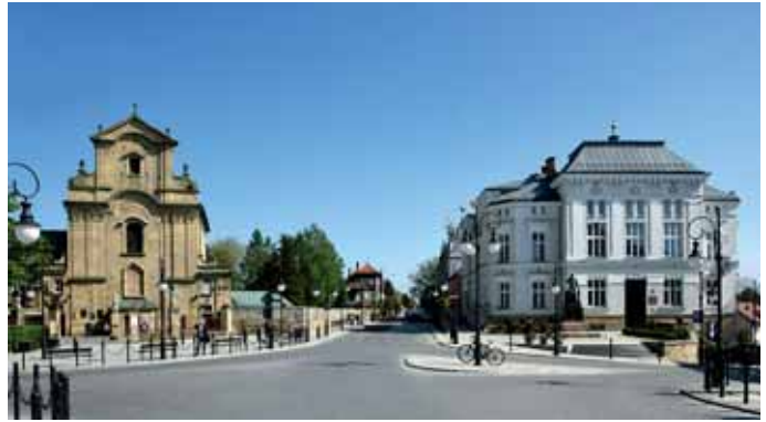
Placu Konstytucji 3 Maja przed i po modernizacji