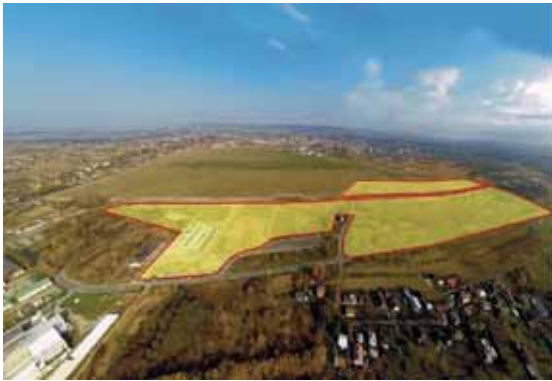
Strefa inwestycyjna przy lotnisku przed modernizacją i zabudową