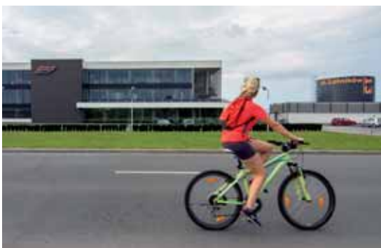
Nowe zakłady w strefie inwestycyjnej przy lotnisku

Dzięki strefie inwestycyjnej przy krośnieńskim lotnisku powstało 230 nowych miejsc pracy. Tereny pod budowę zakładów przemysłowych wykupiło 15 inwestorów. 3 fabryki funkcjonują od kilkunastu miesięcy, a 4 są w budowie. Pozostali przedsiębiorcy są na etapie przygotowania inwestycji.