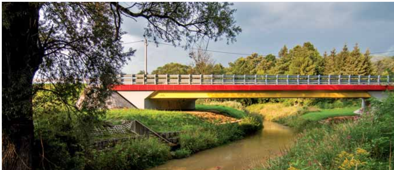
Most na ulicy Słonecznej