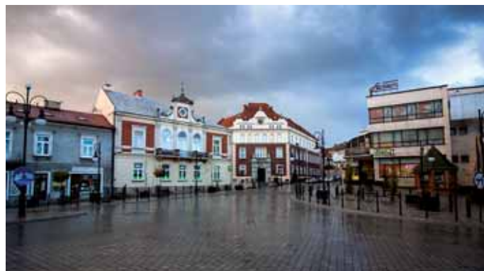
Plac Konstytucji 3 Maja przed i po modernizacji