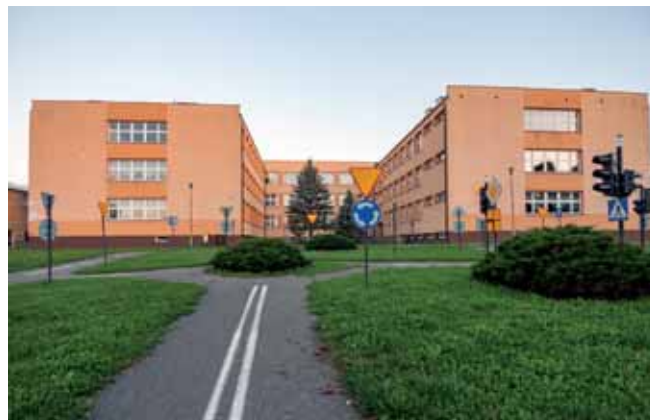
Szkoła Podstawowa nr 14 z Oddziałami Integracyjnymi im. Polskich Olimpijczyków przed i po termomodernizacji

Inwestycja polegała na termomodernizacji 13 miejskich obiektów oświatowych: Miejskiego Zespołu Szkół nr 4, Zespołu Szkół Ponadgimnazjalnych nr 1, Zespołu Szkół Ponadgimnazjalnych nr 4, Zespołu Szkół Ponadgimnazjalnych nr 5, Specjalnego Ośrodka Szkolno-Wychowawczego, Szkoły Podstawowej nr 3, Szkoły Podstawowej nr 4, Szkoły Podstawowej nr 6, Szkoły Podstawowej nr 8, Przedszkola Miejskiego nr 2, Przedszkola Miejskiego nr 3, Przedszkola Miejskiego nr 4, Przedszkola Miejskiego nr 5. Projekt był dofinansowany z Narodowego Funduszu Ochrony Środowiska i Gospodarki Wodnej w ramach dotacji (1,64 mln zł) i pożyczki (3,05 mln zł). Wkład własny krośnieńskiego samorządu to 1,75 mln zł.