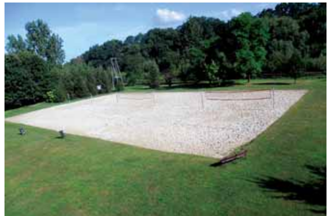
Zdjęcia basenów przed modernizacją

Realizowana w latach 2016-2018 inwestycja odmieniła oblicze basenów przy ul. Bursaki, które pamiętały lata 70. ubiegłego wieku. Powstało mnóstwo nowoczesnych atrakcji, w tym wodny plac zabaw, nowe niecki basenowe i brodzik, bicze wodne, zjeżdżalnia, tor pływacki o długości 25 m, nowy plac zabaw, a także wygodna, trawiasta plaża, duży parking i stojaki dla rowerów. Przez cały okres letni 2018 roku z basenów skorzystało ponad 64 000 osób.