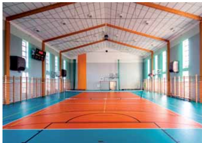
Hala sportowa przy ZSP nr 2 przy ul. S. Szpetnara

Zespół Szkół Ponadgimnazjalnych nr 2 wzbogacił się o salę gimnastyczną o wymiarach 17,6 x 30,0 m. Powstało też zaplecze socjalno-sanitarne, magazyn na sprzęt sportowy, dodatkowe sale lekcyjne i łącznik pomiędzy istniejącym budynkiem szkoły a nową salą. Na realizację zadania otrzymano dofinansowanie z Ministerstwa Sportu i Turystyki w kwocie 823 100,00 zł. Całkowita wartość to 3 198 945,39 zł.