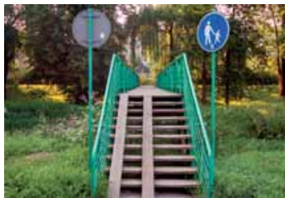
Kładka przy ul. Parkowej