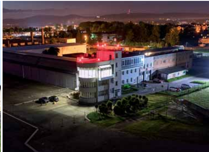
Wieża kontroli lotów przed i po modernizacji