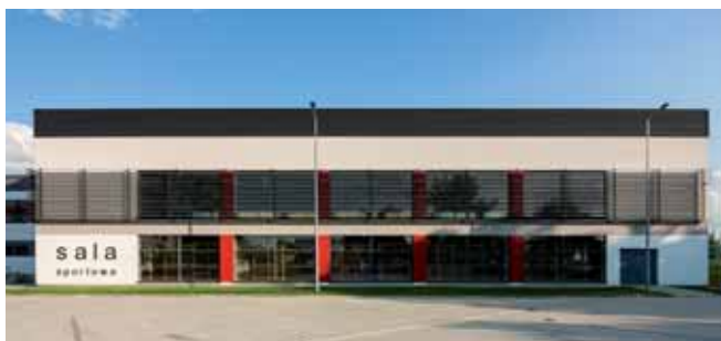
Hala sportowa przy MZS nr 4 przy ul. S. Kisielewskiego

Hala sportowa przy Miejskim Zespole Szkół nr 4 została oddana do użytku 15 maja 2018 roku. Sala z widownią na ok. 200 osób ma wymiary 39 x 23 m. Koszt inwestycji wyniósł 4,7 mln zł, z czego 1,6 mln zł pokryła Unia Europejska.