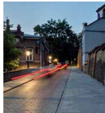
Ulica Zjazdowa po przebudowie