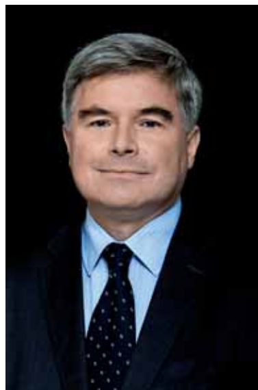
Prezydent Miasta Krosna

Drogi, mosty, mieszkania, nowe miejsca pracy w strefie inwestycyjnej, ale także strefy sportu i rekreacji – jak kompleks odkrytych basenów, place zabaw czy nowe boiska – to najbardziej widoczne inwestycje. Kosztowały one ponad 320 mln złotych! Udało się również zrealizować szereg działań w obszarze ochrony środowiska, spraw społecznych, kultury i edukacji. W trakcie są trzy duże projekty. Pierwszy związany jest z nowym taborem dla MKS Krosno, a dwa pozostałe z budową Biura Wystaw Artystycznych i Etnocentrum. Dzięki tym przedsięwzięciom Krosno rozwija się w sposób zrównoważony. Nie byłoby to jednak możliwe bez przedsiębiorczości i zaangażowania mieszkańców, za co pragnę serdecznie podziękować.