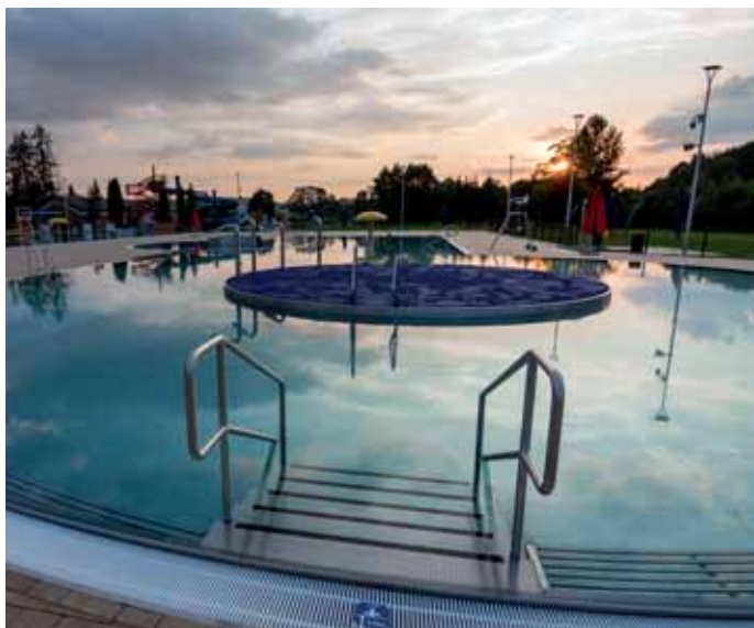
Baseny po modernizacji wykonanej w latach 2016-2018