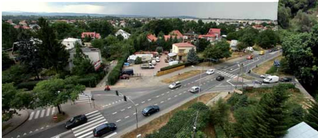
Skrzyżowanie ulic Podkarpacka – Grodzka – Wyszyńskiego (przed przebudową)