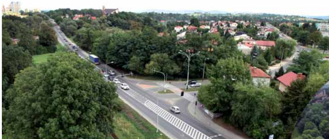
Węzeł drogowy Podkarpacka – Witosza (przed przebudową)