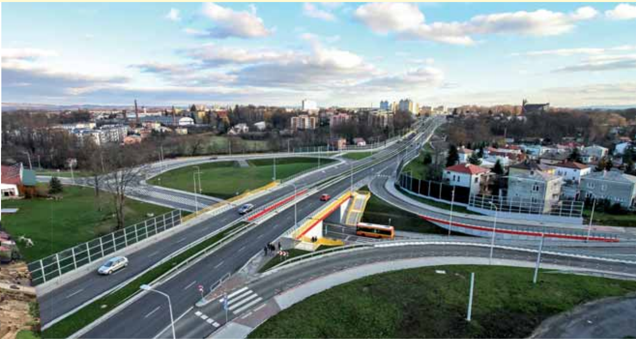
Powyżej – węzeł drogowy Podkarpacka – Witosa (po przebudowie) Poniżej – skrzyżowanie ulic Podkarpacka – Grodzka – Wyszynskiego (po przebudowie)