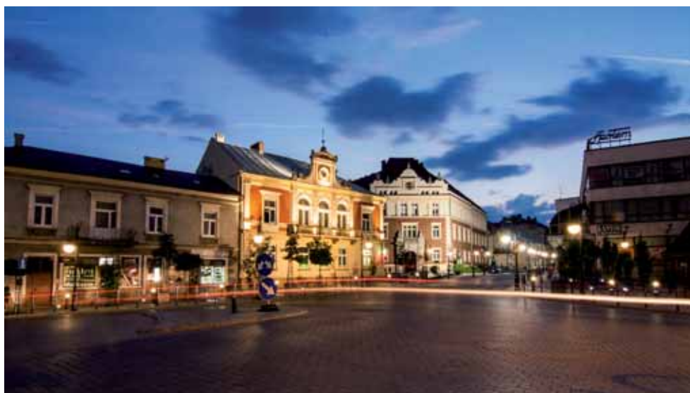
Iluminacja starego miasta