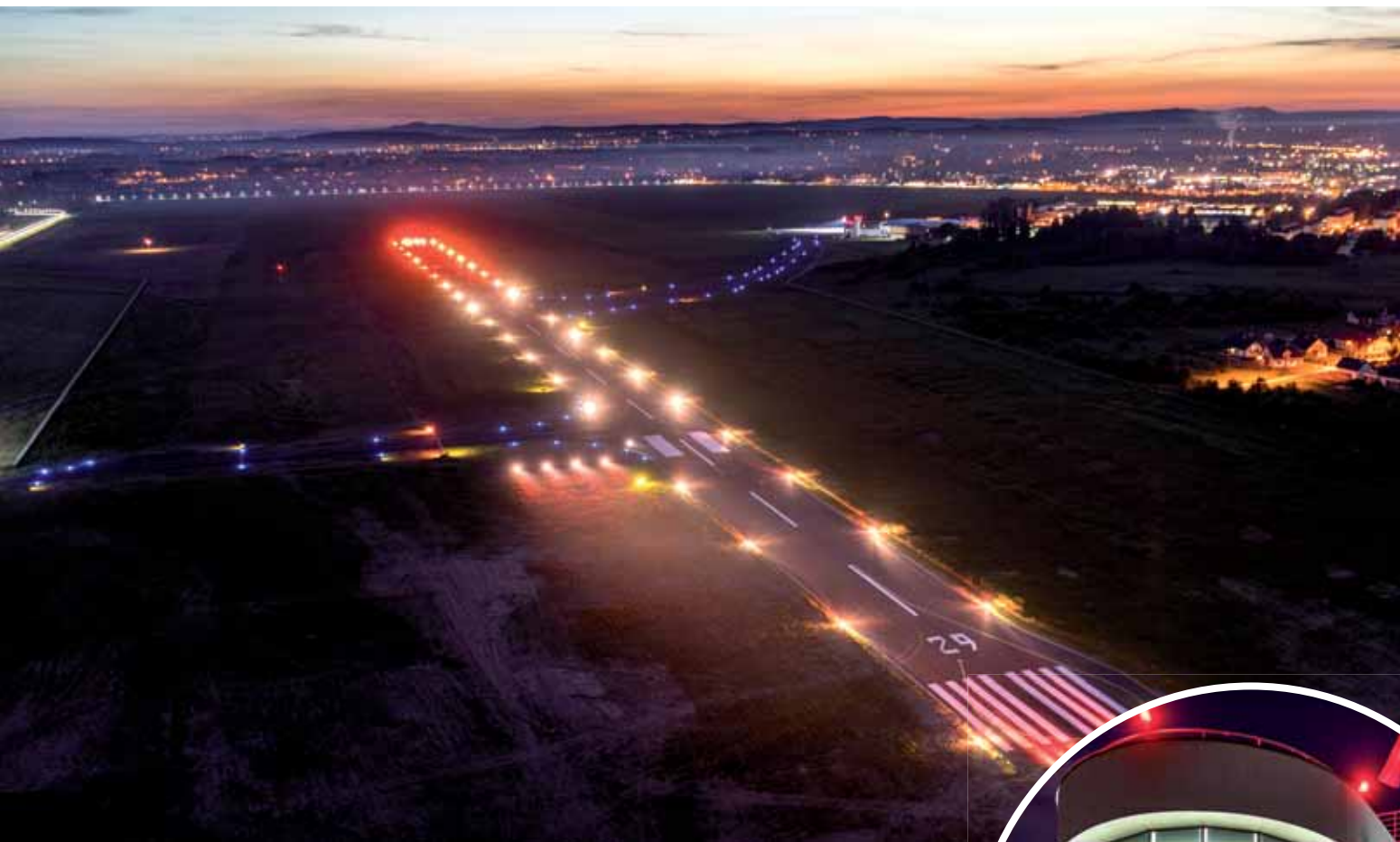
Pas startowy i wieża kontroli lotów po modernizacji