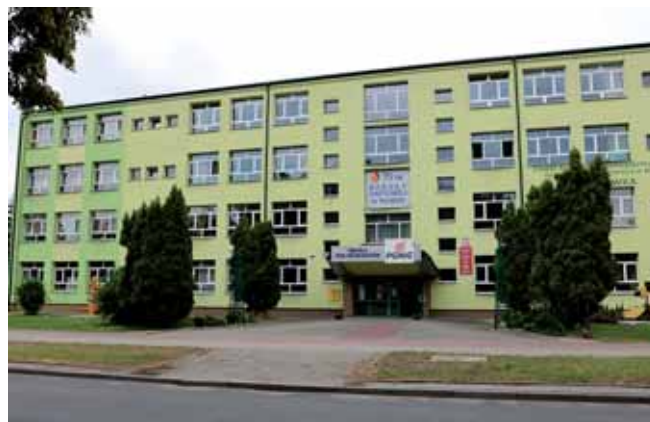
Na zdjęciach budynek ZSP 4 przed i po termomodernizacji