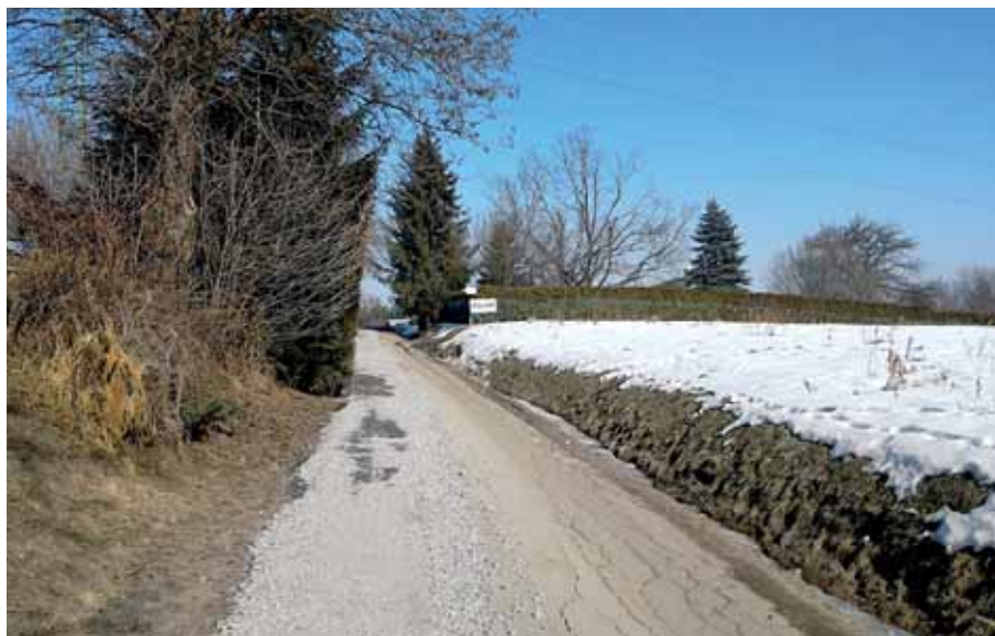
Ulica Zielona przed modernizacją

W 2018 roku ulica Zielona stała się, w pełni oświetloną drogą z chodnikami i ścieżkami rowerowymi. Przed przebudową, która rozpoczęła się latem 2016 roku, była to zniszczona, wąska uliczka, której szerokość w największym miejscu nieznacznie przekraczała 2,5 m. W większości była też pozbawiona chodnika. Miejscami biegnąca przez wąwóz, położona w trudnym terenie, odwadniana była przydrożnymi rowami. Koszt inwestycji to ponad 8,3 mln zł