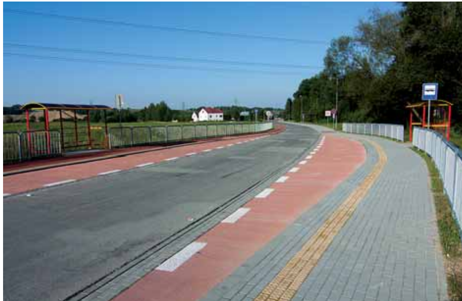
Rozbudowa ul. Wisze – koszt blisko 6,8 mln zł