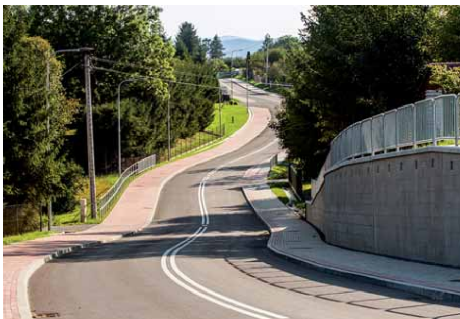
Ulica Zielona po modernizacji