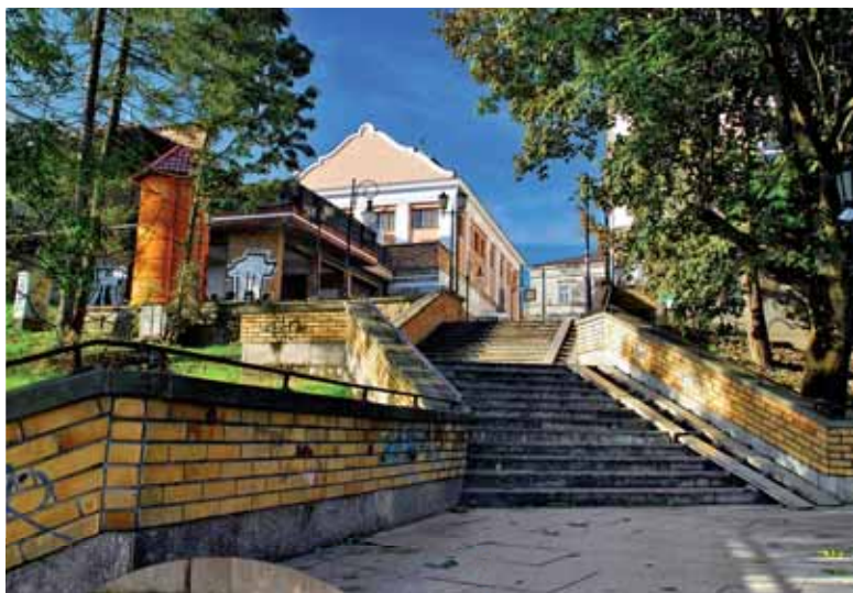
Schody przy ul. Blich przed i po modernizacji