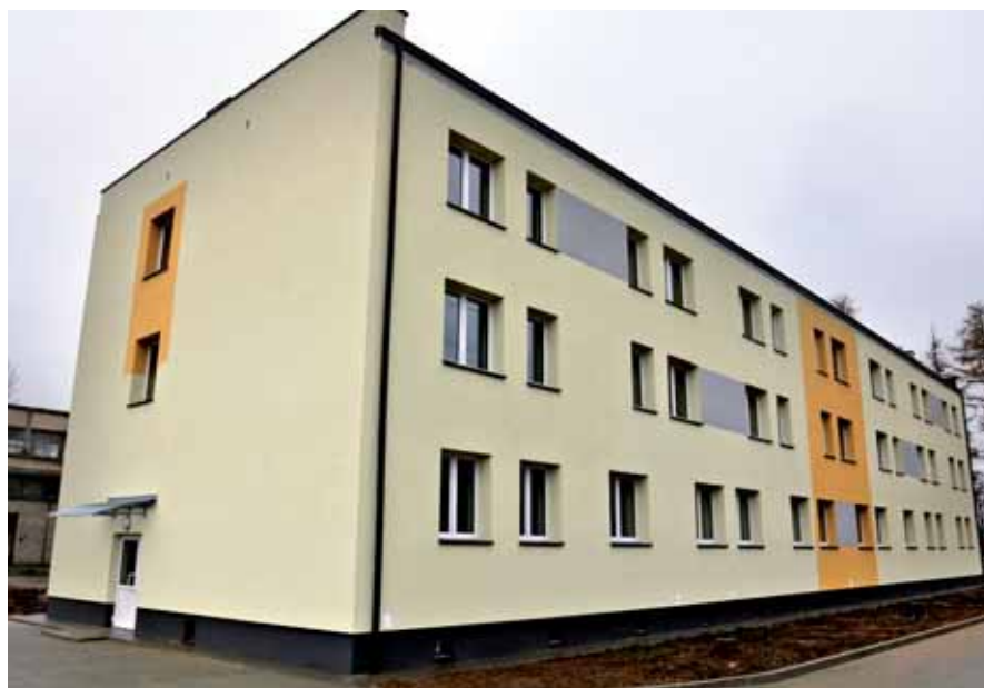
Zaadaptowany budynek pod mieszkania przy ul. Tysiąclecia 11

Zaadaptowano również budynek przy ul. Tysiąclecia 11 na mieszkania socjalne. Efektem końcowym jest oddanie do użytku 30 nowych lokali socjalnych.