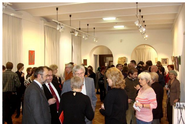
Wernisaż 6. MBATL w Gocseji Muzeji w Zalaegerszeg