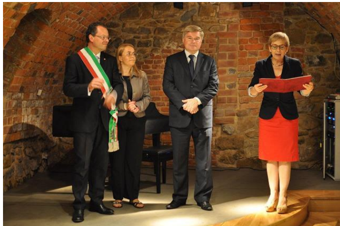
Gualdo Tadino w Krośnie - wystawa tradycyjnej ceramiki.