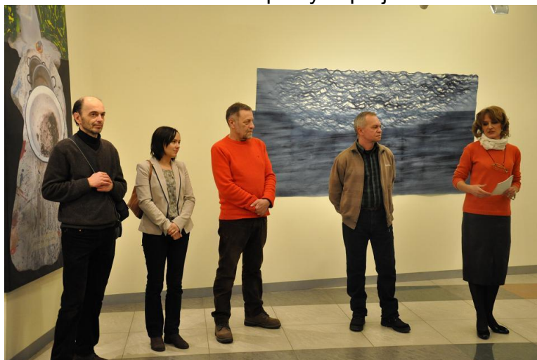
Wernisaż wystawy „ C+S ART.” – 1 lutego 2013 r.

Wystawa „C + S Art” oraz goście – stworzona z nadzieją na przekształcenie się jej w cykl wystaw, organizowanych na Słowacji i zagranicą - to artystyczny eksperyment w dziedzinie aktualizowania obszarów twórczej mentalności w realnej, konkretnej przestrzeni. Dotyczy on średniej generacji artystów, tworzących we wschodniej Słowacji, z centrum w Koszycach. Z reguły ci artyści rozpoczynali swoją działalność pod koniec lat 80-tych, a osiągnięcia odnotowywali w latach 90-tych ubiegłego stulecia. Działalność ich zaowocowała wieloma wspólnymi projektami.