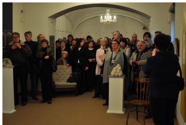
Wernisaż 6. MBATL w Šarišskej Galérii w Prešove – luty 2011