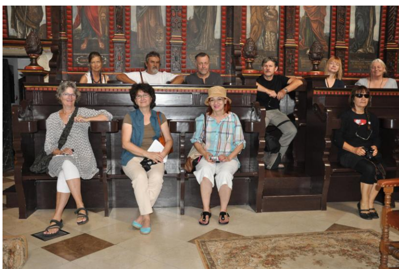
Uczestnicy V Międzynarodowego Pleneru Malarskiego „ PORTRET KROSNA V”.

Każdy z wymienionych artystów przekazał do zbiorów Galerii BWA po jednym z obrazów wykonanych w czasie pleneru.