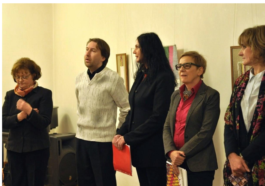
Wernisaż 7. MBATL w Šarišskej Galérii w Prešove – luty 2013