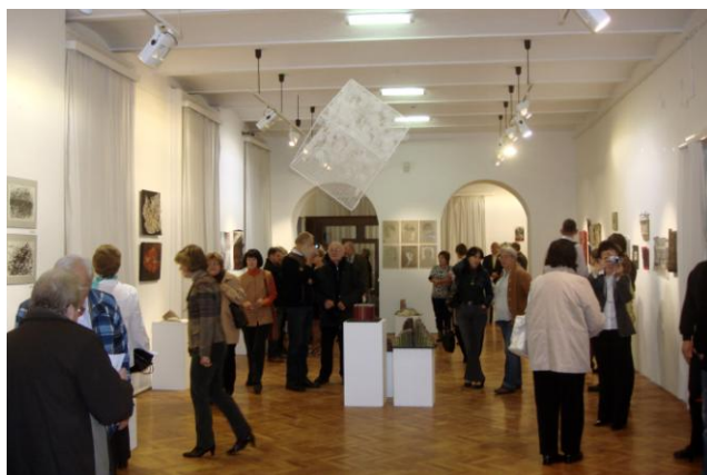
Wernisaż 7.MBATL – Gocseji Museum w Zalaegerszeg – listopad 2013 r.