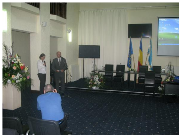
Udział delegacji miasta Krosna w konferencjach w Marl (Niemcy) oraz Targu Mures w Rumunii