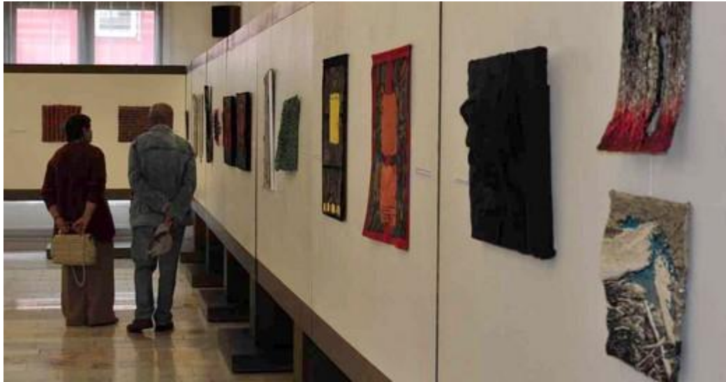
Wernisaż 7. MBATL - Slovenske Narodne Muzeum Ukrajinskej Kultury w Svidniku, październik 2013