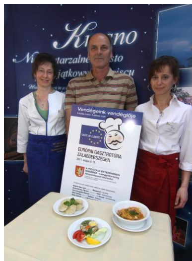
Udział przedstawicieli miasta Krosna w Egerszeg Festival 2011, w ramach projektu „Kuchnie świata, smaki Europy”