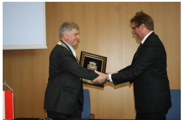
Podpisanie umowy partnerskiej Krosno – Fjell, w Krośnie 24 sierpnia 2013 r.