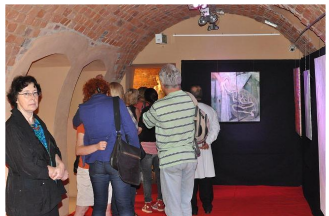
Wernisaż wystawy - Mistyczny świat Vaho Hazalii. Współczesna sztuka gruzińska