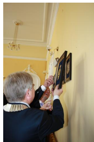
Podpisanie umowy partnerskiej Krosno – Gualdo Tadino, 1 września 2012 r. w Krośnie.