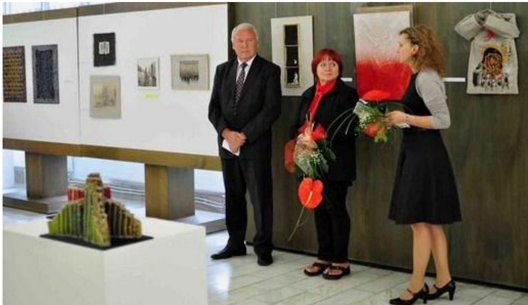
Wernisaż 7. MBATL - Slovenske Narodne Muzeum Ukrajinskej Kultury w Svidniku, październik 2013